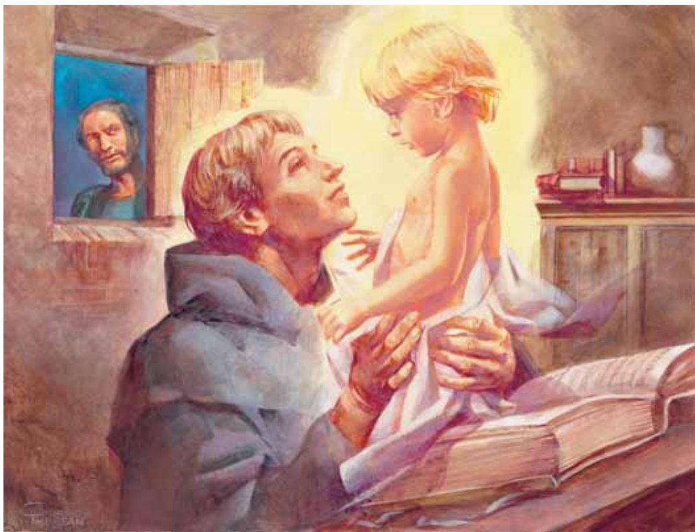
Tiso z Camposampiera je svědkem zjevení Dítěte Ježíše sv. Antonínu, mal. Giorgio Trevisan

Uviděli světce, který s rozpjatými pažemi klečel u modlitebny s očima upřenýma k nebi. Na knize, jež před ním ležela, zpozorovali líbezného chlapce, který zcela ponořen do světla se na světce usmíval.