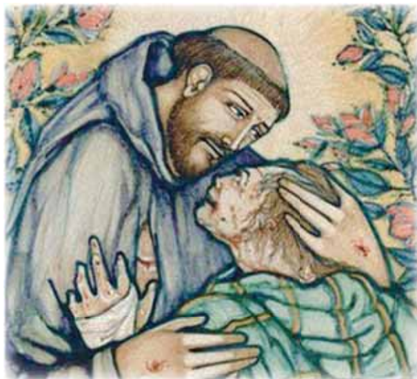
SVATÝ FRANTIŠEK Z ASSISI OBJÍMÁ MALOMOCNÉHO

Novověké medicíně se podařilo malomocnoství ve vyspělých zemích vymýtit. To ale neplatí o mnohých národech Asie, Afriky a Oceánie, kam dosud pokrok lékařské vědy pronikl jen částečně.