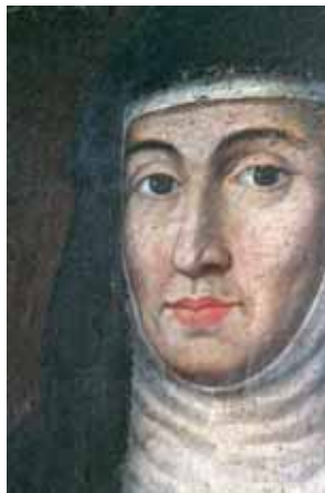
Marie z Agredy

V 17. stol. se zjevovala Panna Maria ve španělském městě Agreda převorce tanních františkánek Marii od Ježíše. Seznámila ji se svým životem a postavením v dějinách církve. Marie z Agredy zaznamenala tyto vize v knize „Mystické město Boží“, jíž se dostalo církevního schválení. Vizionářka byla prohlášena „ctihodnou služebnicí Boží“, což bylo dříve předstupněm k blahověčení. Měla dar bilokace, podle dochovaných zpráv ji Matka Boží přenesla až k pohanským indiánům do Latinské Ameriky, kde jim údajně hlásala evangelium. Jejím velkým ctitelcem se stal i papež Jan Pavel II., který dal podnět k zahájení procesu blahověčení. Z jejího spisu vybíráme některé statě týkající se působení Matky Boží v prvotní církvi.